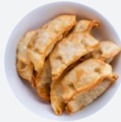
揚げ餃子 Fried Gyoza