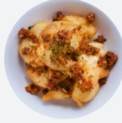
ガーリックシュリンプ Garlic Shrimp