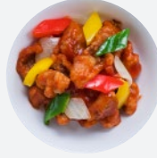
酢豚 Sweet and Sour Pork