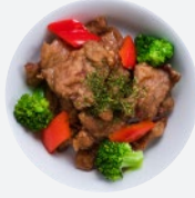
ジンジャーフライドビーフ Ginger Fried Beef