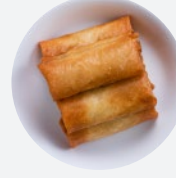
春巻き Spring Roll