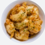
ハニーマスタードシュリンプ Honey Mustard Shrimp