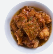
ハニーマスタードチキン Honey Mustard Chicken