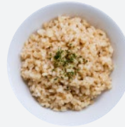
玄米 Brown Rice