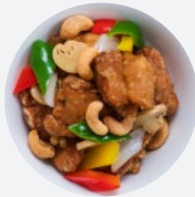
クンパオチキン Kung Pao Chicken