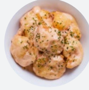
マヨネーズシュリンプ Mayonnaise Shrimp