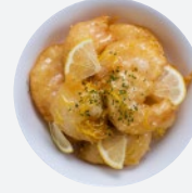
レモンシュリンプ Lemon Shrimp