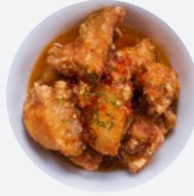
ディッピングチリチキン Dipping Chili Chicken