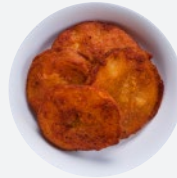
スパイシーポテト Spicy Potatoes