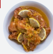
レモンチキン Lemon Chicken