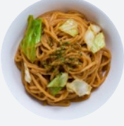
焼きそば Fried Noodles