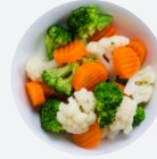
スチームベジタブル Steam Vegetable