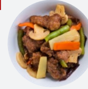
チンジャオロース Chinjaolose